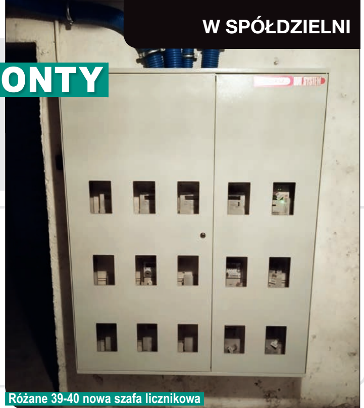
Różane 39-40 nowa szafa licznikowa

Wymieniliśmy również oświetlenie na klatkach na oświetlenie typu LED wraz z czujnikami ruchu, a przy wejściach na klatki zostały zamontowane przeciwpożarowe wyłączniki prądu.