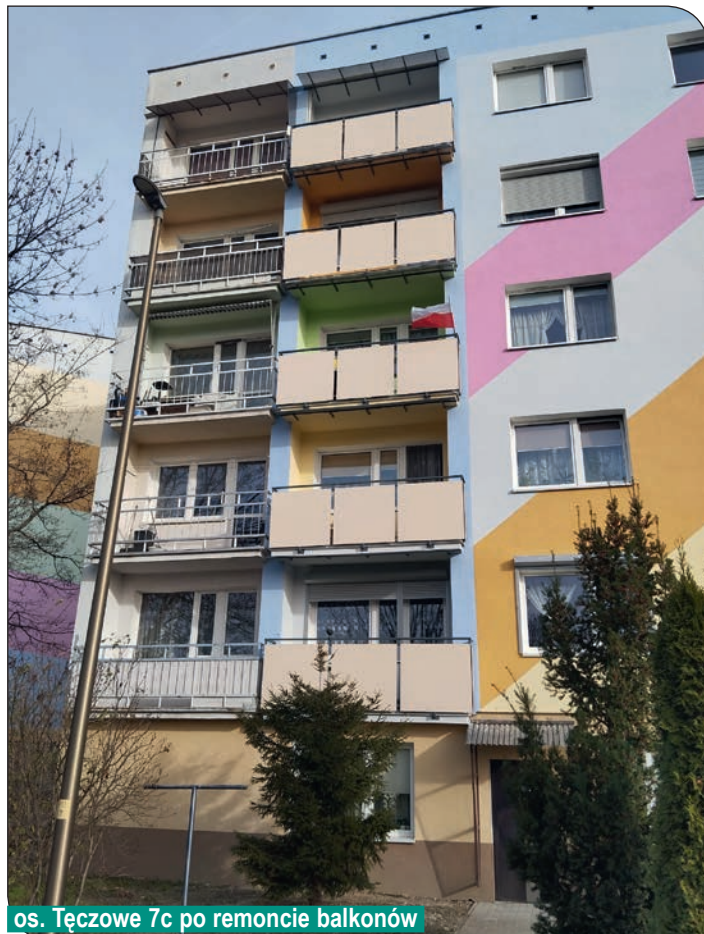
os. Tęczowe 7c po remoncie balkonów