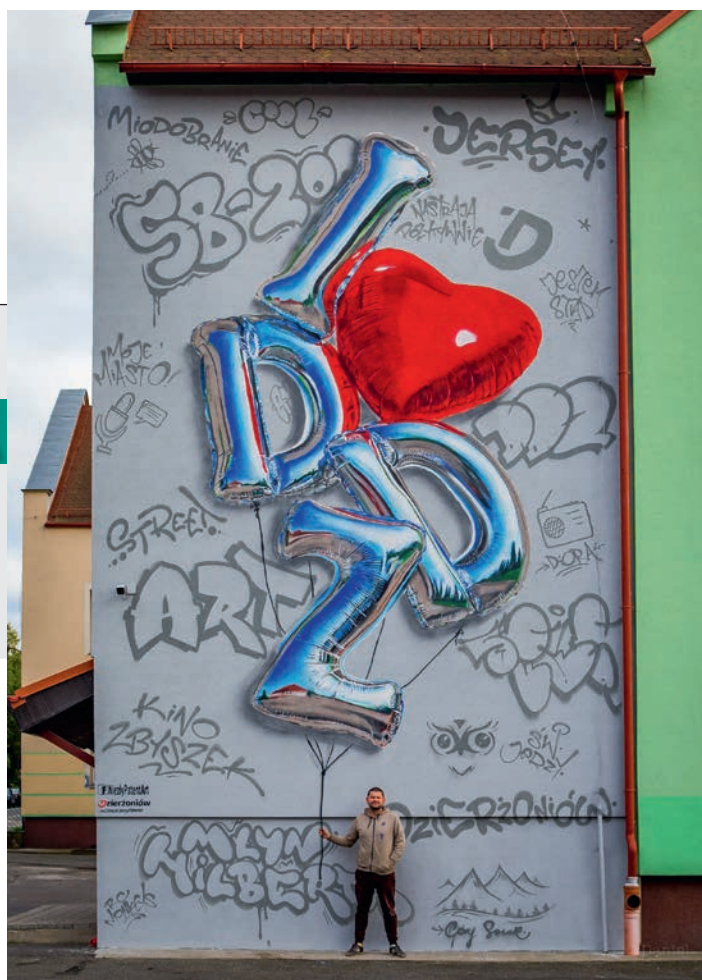
Nowy mural powstał w ramach realizowanego przez miasto projektu „Dzierżoniów pełen pasji” ▶

To doskonale tło do zrobienia sobie pamiątkowego zdjęcia. Zapraszamy pod OPS przy ul. Szkolnej.