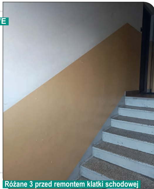
Różane 3 przed remontem klatki schodowej

W budynku na osiedlu Błękitnym 6a,b,c rozpoczęliśmy prace związane z remontem klatek schodowych. W ramach prac pomalujemy ściany, sufity, poręcze, parapety, a w miejscu lamperii zostanie położony tynk mozaikowy. Zamontujemy również nowe drewniane nakładki na poręcze oraz wymienimy na nowe drzwi do piwnicy. W budynku na osiedlu Różanym 3 zakończyliśmy w/w prace.