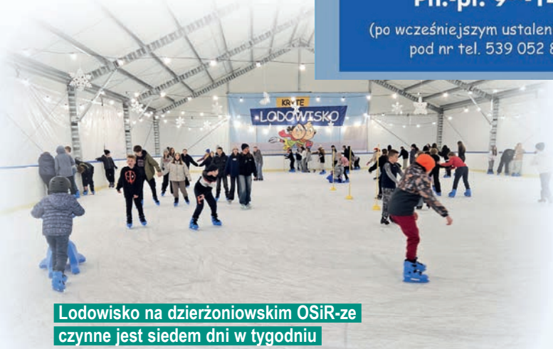
Lodowisko na dzierżoniowskim OSiR-ze czynne jest siedem dni w tygodniu