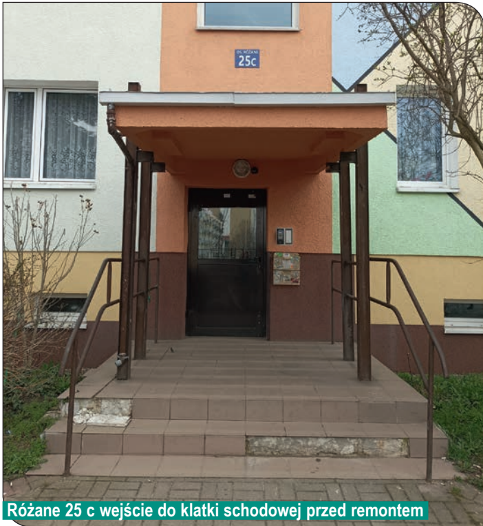
Różane 25 c wejście do klatki schodowej przed remontem

okładziny z płytek, wykonaliśmy nową okładzinę z granitu, zamontujemy nowe balustrady.