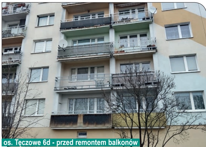
os. Tęczowe 6d - przed remontem balkonów

balkonami. W budynku na os. Tęczowym 7c (pion mieszkań 1,3,5,7,9) - zakończyliśmy prace związane z remontem balkonów w ramach których wymieniliśmy balustrady na nowe stalowe ocynkowane, malowane proszkowo, a na balustradach zostały zamontowane panele ozdobne. W ramach prac związanych z remontem balkonów zamontowane zostały również zadaszenia nad balkonami.