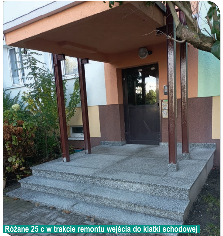
Różane 25 c w trakcie remontu wejścia do klatki schodowej