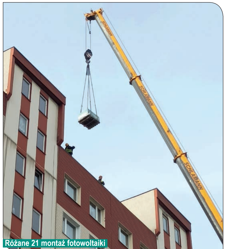
Różane 21 montaż fotowoltaiki