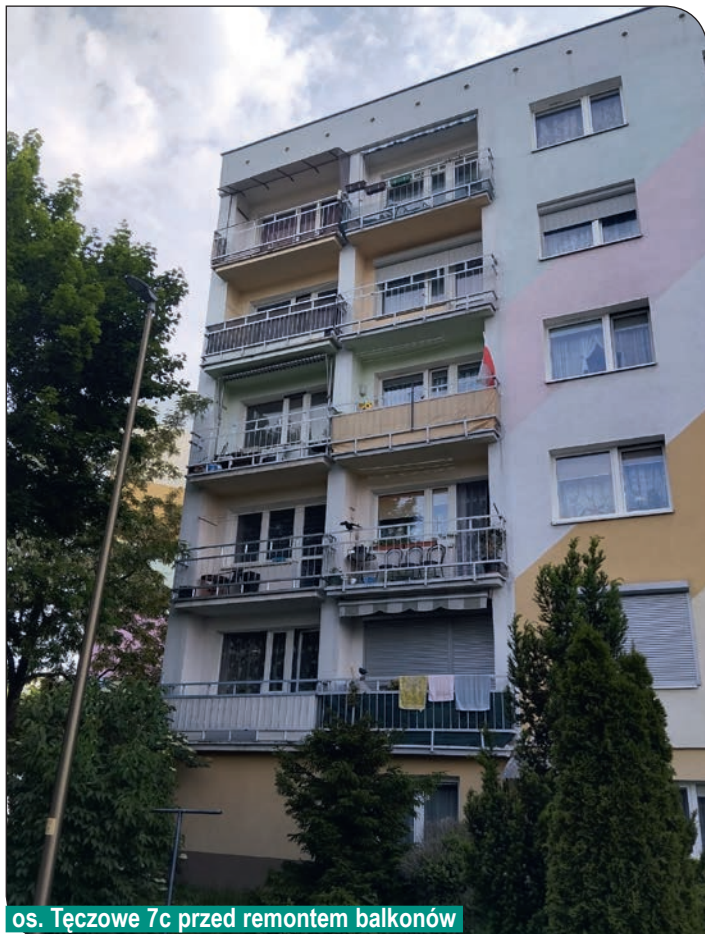
os. Tęczowe 7c przed remontem balkonów