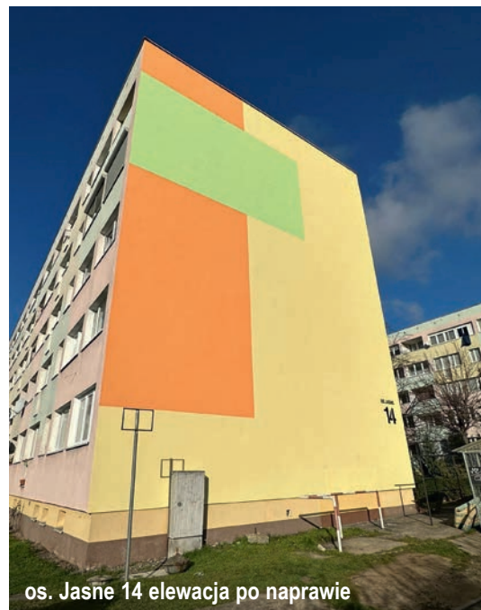
os. Jasne 14 elewacja po naprawie

Spółdzielnia Mieszkaniowa w Dzierżoniowie w trosce o zwiększenie bezpieczeństwa w trakcie używania kucharek gazowych oraz piekarników przedstawia kilka ważnych zasad zwiększających bezpieczeństwo osób starszych w kuchni. Zachęcamy do zapoznania się i stosowania.