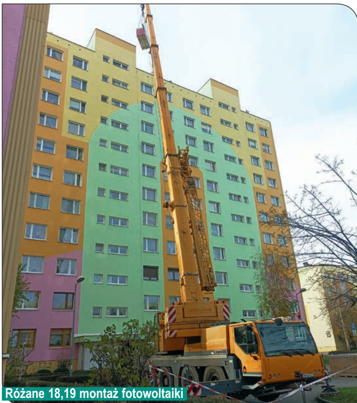
Różane 18,19 montaż fotowoltaiki

zostanie zamontowana na specjalnej konstrukcji.