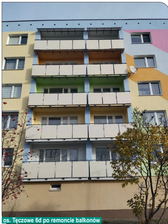
os. Tęczowe 6d po remoncie balkonów